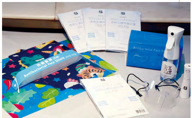
以 InvisiArma™ 塗層及整合鉑技術開拓的防疫產品