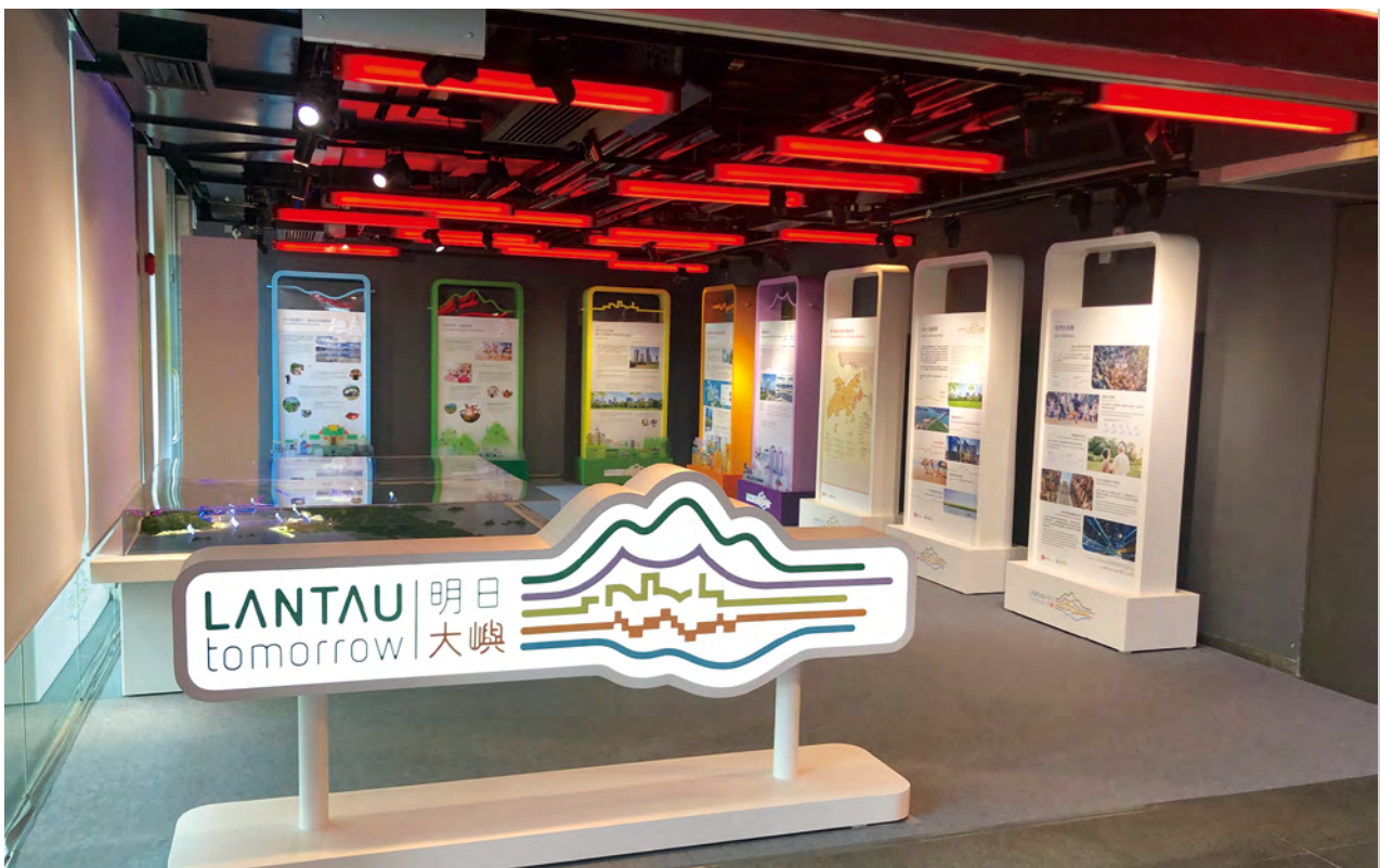
「明日大嶼」願景提出在中部水域鄰近交椅洲填海興建人工島，可提供 15 萬至 26 萬房屋單位 Lantau Tomorrow Vision proposes reclamation in Central Waters for developing the Kau Yi Chau Artificial Islands, which will provide 150,000 to 260,000 housing units

如果從租金來看，中環甲級寫字樓的呎租高昂。雖然近月的報告指出，本地寫字樓租金有所下跌，但下跌的速度已放緩。至於空置率，即使是現在的經濟環境，中環的空置率亦只有約 7%，在國際上仍然是較低水平，反映香港作為一個國際貿易金融中心，對商業用地的需求強勁。🚫